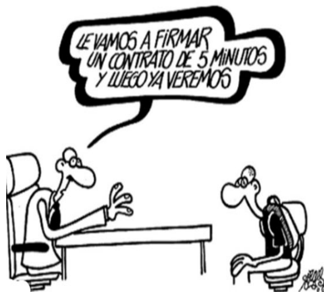
Viñeta de Forges

Se propone esta Viñeta de Forges para iniciar el debate. ¿Qué le está ofreciendo el empresario al trabajador? ¿Existe en la actualidad el trabajo estable? ¿Cómo definirías precariedad laboral? ¿Podrías describir tu trabajo ideal?